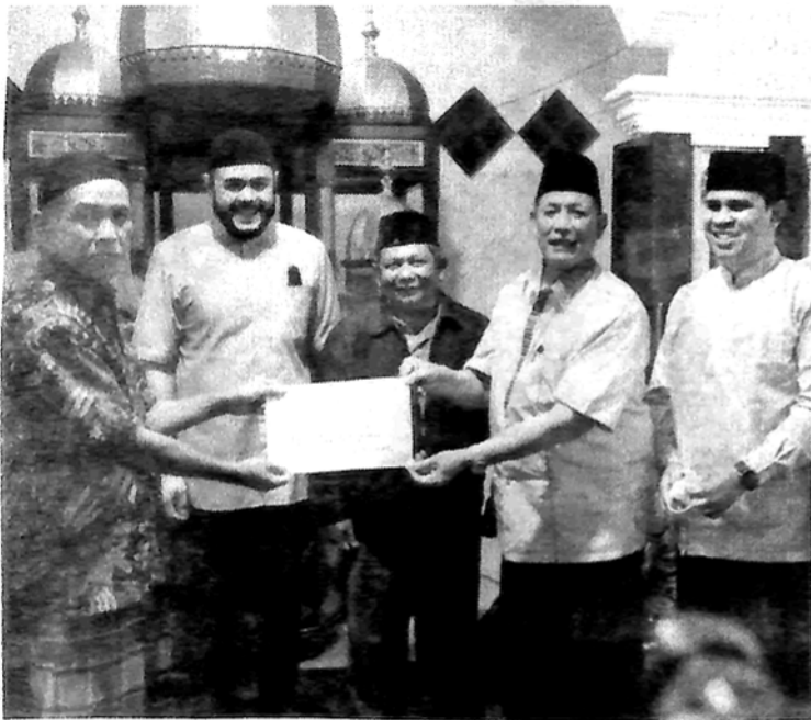
PENGURUS Masjid Baiturrahman menerima bantuan untuk pembangunan Masjid dari TSR Pemprov Sumbar.