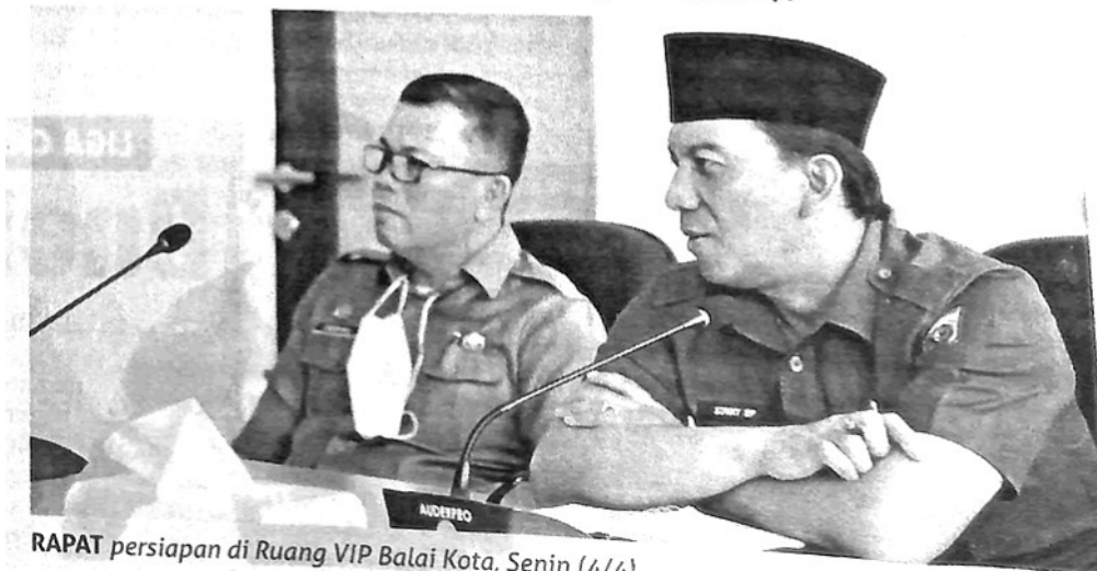
RAPAT persiapan di Ruang VIP Balai Kota, Senin (4/4).

Turut hadir pada kesempatan tersebut asisten I, II dan III Padangpanjang dan Tanahdatar, Kadis Porapar, Kominfo, Bappeda dan undangan lainnya. (sup)