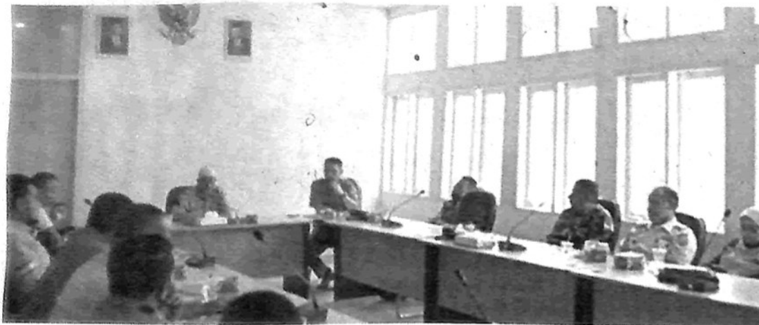
Rapat bahas penataan pasar Kuliner Padang Panjang.