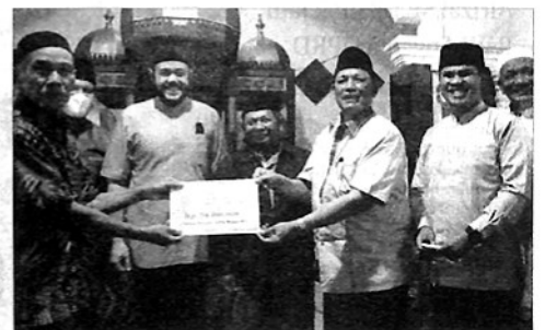
PENYERAHAN Bantuan TSR Pemprov Sumbar kepada Pengurus Masjid Baiturrahman Bukit Surungan.

Hadir asisten I, II dan III Padangpanjang dan Tanahdatar, Kadis Porapar, Kominfo, Bappeda dan undangan lainnya. (ned)