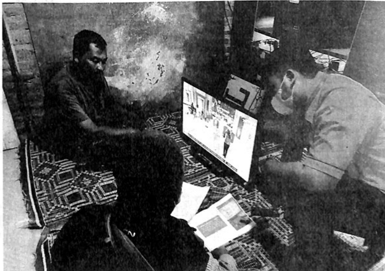
MEMBERIKAN STB - Teknisi Kominfo saat memberikan STB gratis pada salah seorang warga penerima.

dapat alat ini. Selama ini hanya bisa nonton satu stasiun TV saja. Dulu nonton TV banyak sumbu. Sekarang sudah terang (jernih)," kata Fuji.