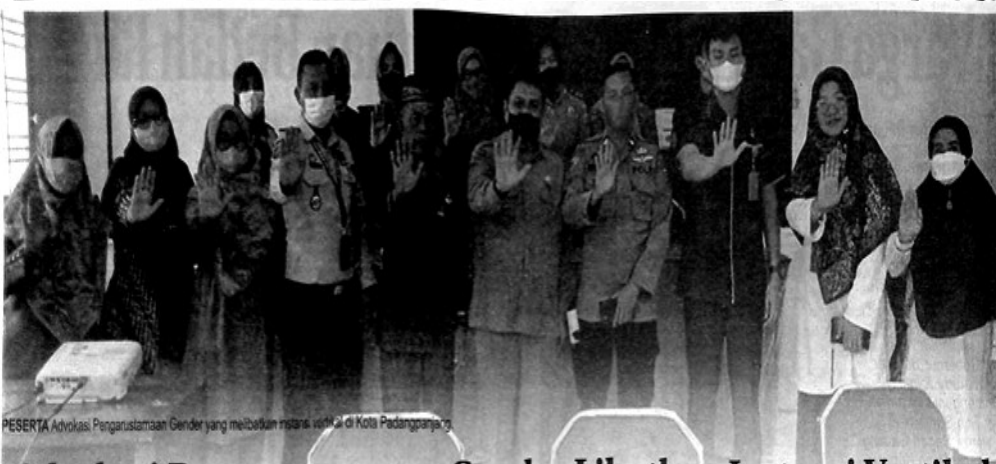
PESERTA Advokasi Pengarusutamaan Gender yang melibatkan instansi vertikal di Kota Padangpanjang.

"Bantuan dari Pemprov sangat bermanfaat untuk kelangsungan pembangunan Masjid Baiturrahman ini. Semoga pembangunannya masjid ini dapat berjalan dengan lancar," ujarnya. (ned)