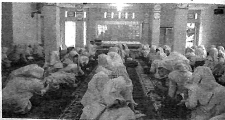
Peserta pesantren Ramadan di Padang Panjang