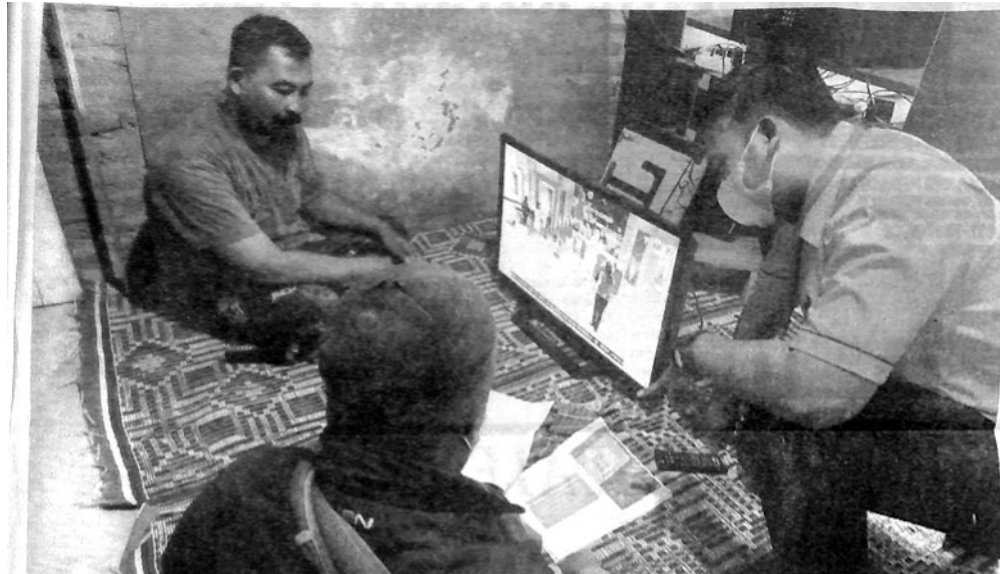
PEMASANGAN STB gratis bagi warga yang kurang mampu yang ada di Kelurahan Tanah Pak Lambik, Kecamatan Padangpanjang Timur.